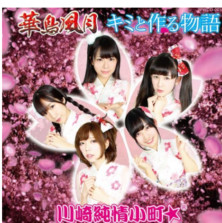
8th 「華鳥風月/キミと作る物語」 (2017年3月21日発売)