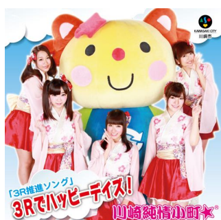
4th 「3Rでハッピーデイズ！」 (2014年4月1日発売)