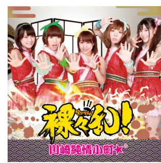
6th 「裸々乱！」 (2015年8月26日発売)