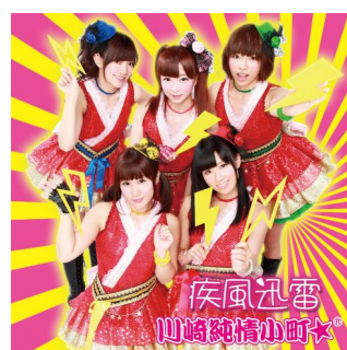
5th 「疾風迅雷」 (2014年7月23日発売)