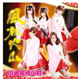
3rd 「風林火山」 (2014年1月10日発売)