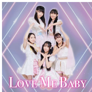
11th 「Love Me Baby」 (2023年12月29日発売)