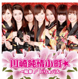
1st 「一輪華/ドリ☆バル」 (2012年5月25日発売)