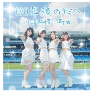
12th 「100年後のキミへ」 (2025年3月19日発売)