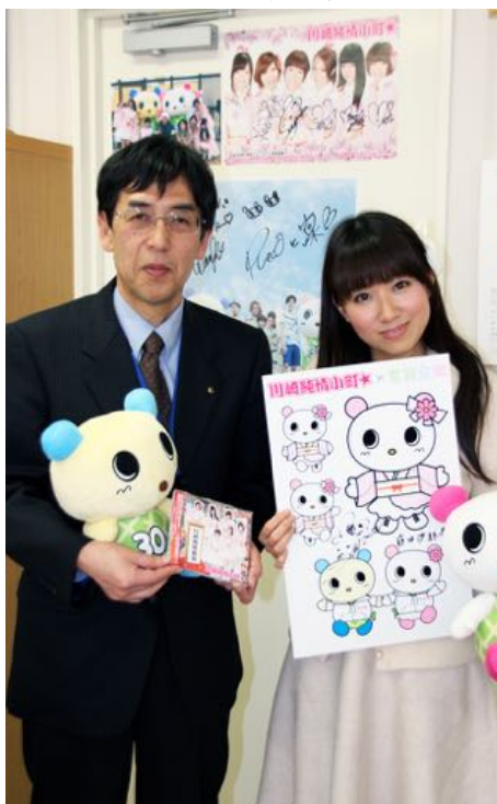
宮前区長と川崎純情小町☆