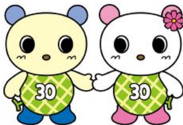
宮前区のゆるキャラ「宮前兄妹」