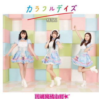
10th 「カラフルデイズ/ GENESIS」 (2022年4月3日発売)