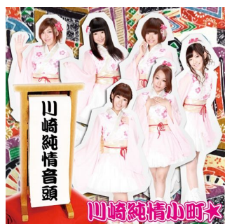
2nd 「川崎純情音頭」 (2013年2月8日発売)