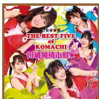
7th 「BEST FIVE of KOMACHI」 (2016年10月14日発売)