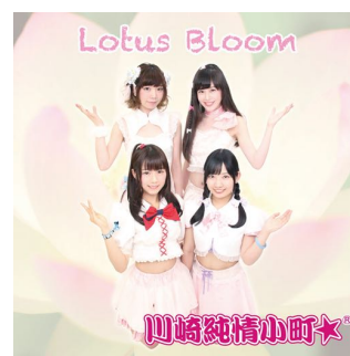
9th 「Lotus Bloom」 (2018年5月25日発売)